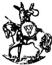
Skrás. 1905 nr. 1

Merkið á eingöngu að nota á steinoliulát.