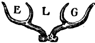
Skrás. 1905 nr. 2