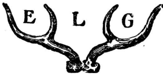
Skrás. 1905 nr. 2