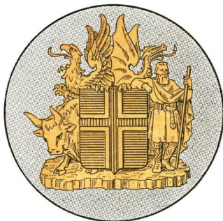
Húfumerki hreppstjóra og bifreiðaeftirlitsmanna. Stærðir: Hreppstjóra 3 cm, bifreiðaeftirlitsmanna 4 cm.