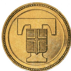
Hnappar tollvarða. Stærðir: 2,4 cm og 1,6 cm.