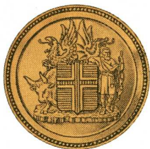
Hnappar sýslumanna. Stærðir: 2,4 cm og 1,6 cm.