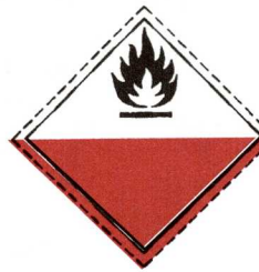
Hætta á sjálfendrun