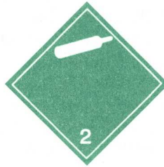
Óeldfim, ekki eitruð lofttegund