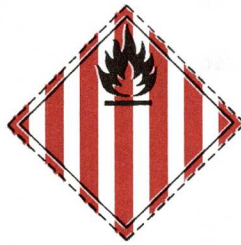
Eldhætta (eldfimt fast efni)