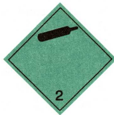
Óeldfim, ekki eitruð lofttegund