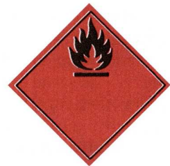
Eldhætta (eldfimur vökvi)