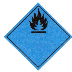
Hætta á myndun eldfimra lofttegunda við snertingu við vatn