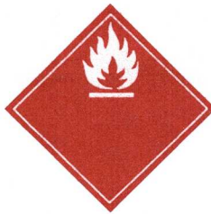
Eldhætta (eldfimur vökvi)