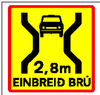
J43.xx Einbreið brú með þröngri akbraut.

Merki þetta er notað með viðvörðunarkerki til að vara við einbreiðum jarðgöngum.