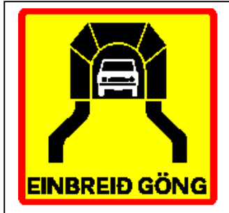
J41.51 Einbreið jarðgöng.

Merki þetta er notað með viðvörðunarkerki til að vara við einbreiðum jarðgöngum.