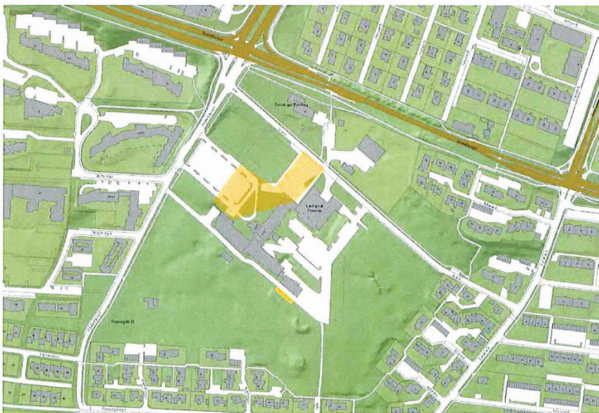
Mynd 2. Ný gjaldskyld stæði sýnd á Borgarvefsjá, fyrir gjaldskyldu.