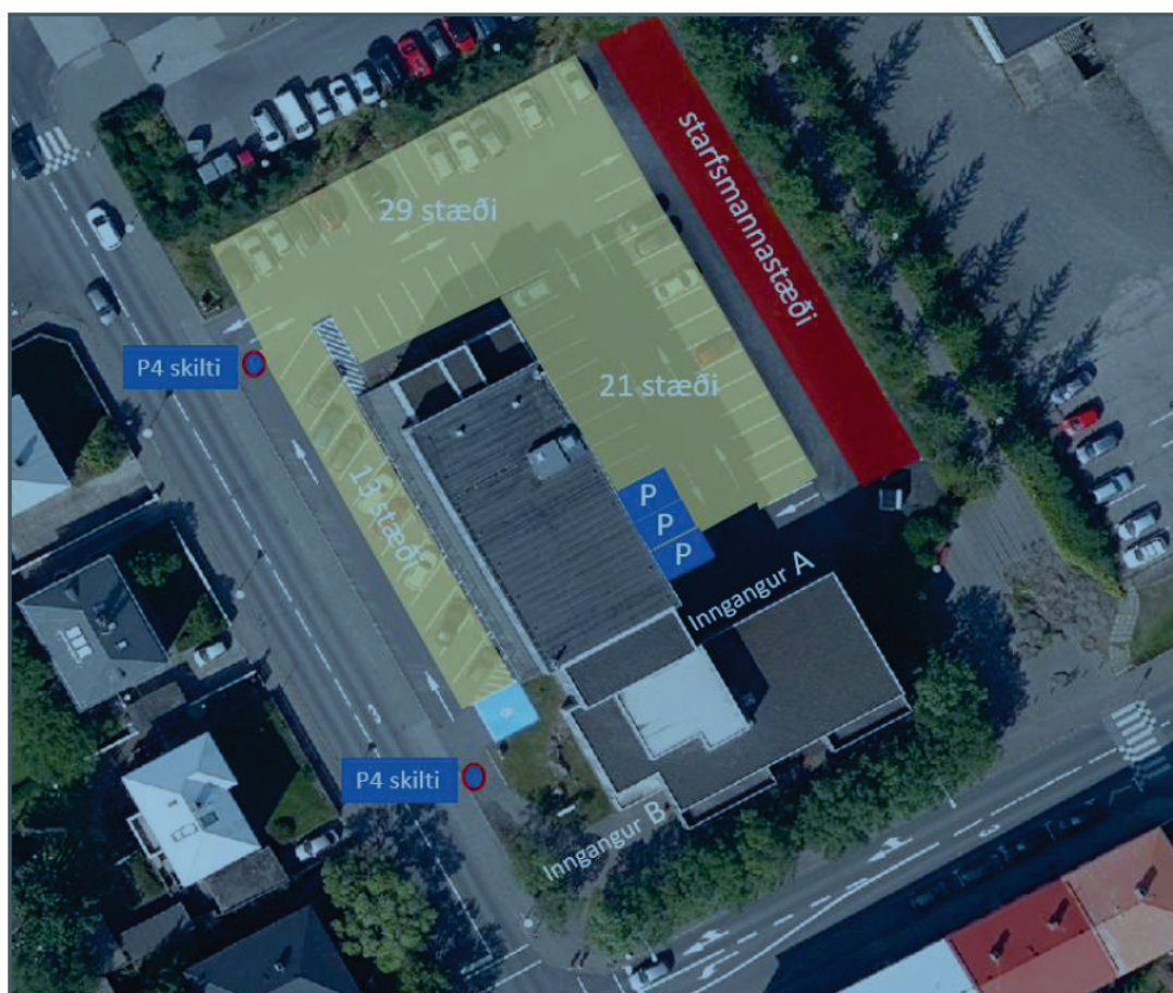
Mynd 1. Nýtt gjaldskylt svæði á Eiríksgötu.