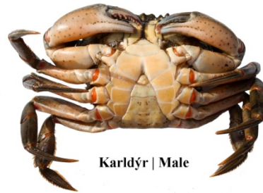
Karldýr | Male