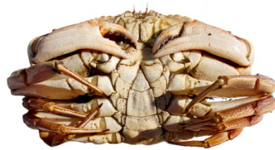
Karldýr | Male