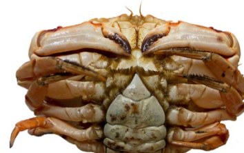
Kvendýr | Female